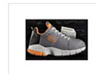
Reduce and Run